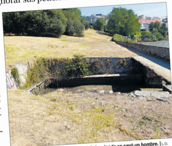
Viejo embarcadero en el parque de O Seixo donde se cayó un hombre.

“Todo sigue exactamente igual, no existe ni la más mínima señalización, ni un triste vallado, ni tan