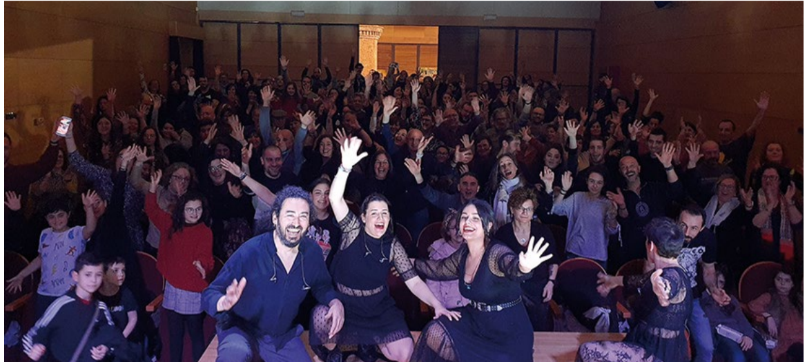
■ As Tanxugueiras xa actuaron na Fábrica no 2020

◆ O Parque da Lagoa de Mera acollerá o xoves 2 de maio o Quérote-Fest, un festival no que actuarán unha selección dos mellores artistas e grupos galegos do momento. Forman o cartel do evento As Tanxugueiras, Grande Amore, The rapants, Mondra, Lonreira, Os Festicultores, D Ninghures, Orquestra Los Satélites e Manuel Turnes (DJ) . O acceso é libre e gratuíto. Está previsto o inicio da festa para as 20:00 horas. A TVG emitirá o concerto.