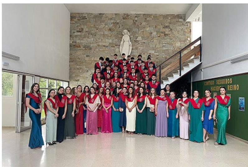
■ CRISTO REI