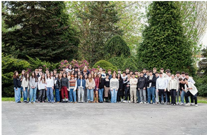
■ IES MIRAFLORES