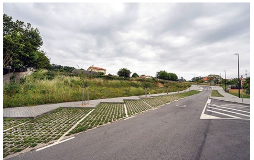
■ As vivendas de Mera estarán no centro da nova urbanización, na rúa Eduardo Galeano, fronte ao monumento ao profesorado