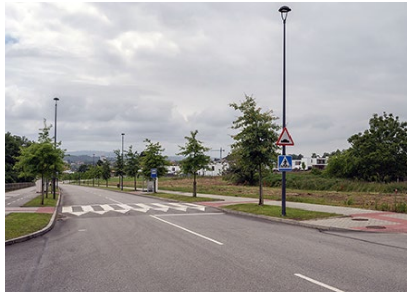
■ Os pisos de Dorneda construíranse na avenida central da urbanización de Xaz

Para os outros 100 pisos de Xaz e Mera, a empresa que formará as cooperativas, adquirirá o solo a propietarios privados.