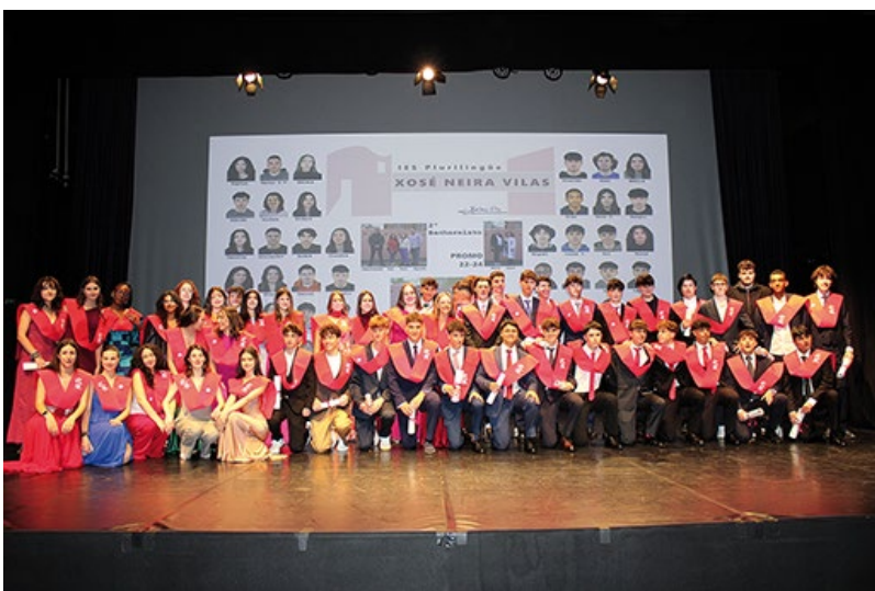
■ IES NEIRA VILAS