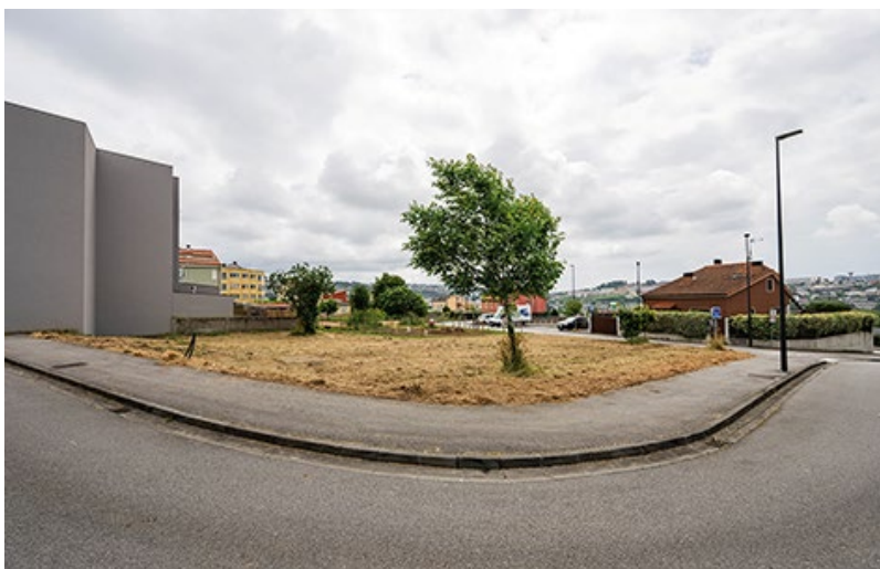
■ O edificio de Perillo estará situado na rúa dona Emilia, en pleno centro da localidade