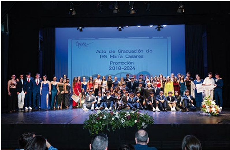
■ IES MARÍA CASARES

◆ Un total de 246 rapaces e rapazas do municipio finalizaron os seus estudos de educación secundaria o pasado mes de maio. Grazas ao seu esforzo persoal, ao das súas familias e ao excelente profesorado existente nos centros públicos de Oleiros, os mozos e mozas graduados lograron completar de maneira satisfactoria unha importante etapa nas súas vidas, que lles permitirá continuar estudando e formándose nos seus futuros oficios e profesións.