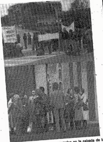
Los vecinos, con sus pancartas, sentados en la calzada de la Nacional VI, postura en la que permanecieron durante media hora. En la otra fotografía, momento que un grupo de vecinos mantiene animada charla con el jefe de Obras Públicas