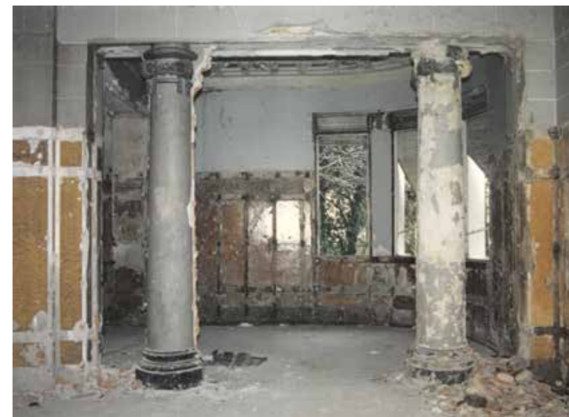
Detalle da situación do edificio antes da restauración