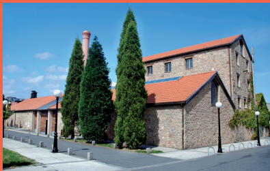
Auditorio da Fábrica