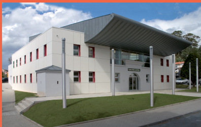
Auditorio Gabriel García Márquez