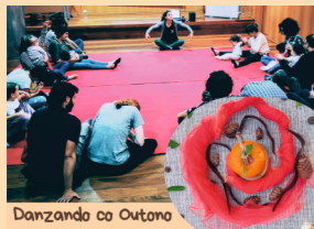
Danzando co Outono

Conectaremos co outono a través dos seus olores, dos seus