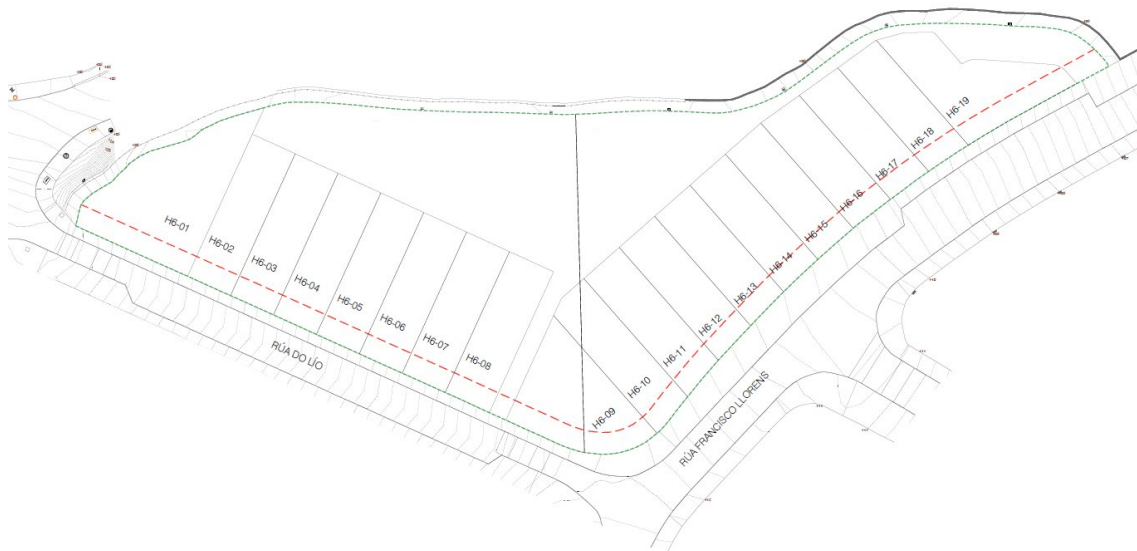
Imaxe 2. Sub-parcelas da mazá H6.

A solución permite xerar espazos libres privados comunitarios no interior das parcelas, evita unha fragmentación excesiva do parcelario e resolve o problema das prazas de aparcadoiro, adoitándose nas 8 vivendas da Rúa do Lío unha disposición en superficie; e para as 11 vivendas da Rúa Francisco Llorens un único acceso a garaxes no punto máis baixo da rúa, proxectándose un vial interior que da servizo ás prazas de cada vivenda.