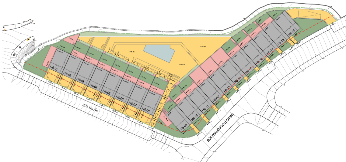
Imaxe 3. Implantación Planta Baixa H6.