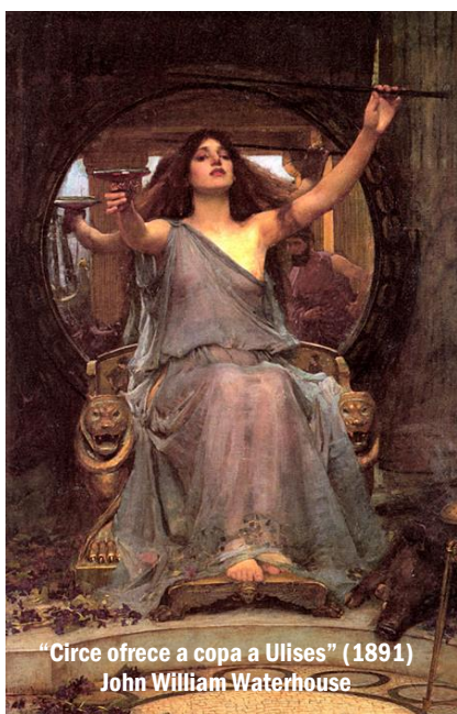
"Circe ofrece a copa a Ulises" (1891) John William Waterhouse