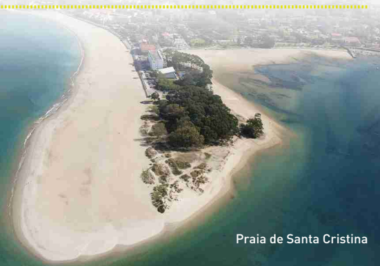
Praia de Santa Cristina