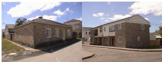
viviendas en ARNEIRO

que máis me interesou foi poder escribir en diálogo con ela. En xeral, o proceso de escritura pode ser algo solitario e gustábame o experimento de pensalo como unha conversa.