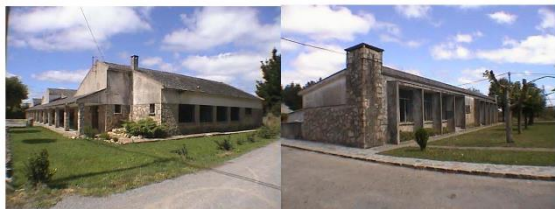
Escuela de capacitación agraria ARNEIRO escuela unitaria ARNEIRO

Interesoume tamén o ángulo elixido pola fundación para a colección, unha literatura de textos híbridos e singularidades; unha aposta polos xéneros que están nas marxes. Penso que o libro causa nas persoas lectoras certa perplexidade: é unha novela? ou outra cousa? Ás veces chámolle novela simplemente porque me parece que en moitos sistemas literarios textos moito máis radicais que este reciben o nome de novelas e, polo tanto, paréceme importante que esteamos dispostos a chamarlles novelas a cousas que xogan coas nosas expectativas do que unha novela debería ser. Pero interésame máis a perplexidade que buscar unha definición fixa: a literatura ten que xogar coas nosas ideas do que pode ser o literario, e agradezo que Euseino? crease unha colección que explicitamente nos convida a iso.