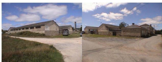
parque de maquinaria ARNEIRO