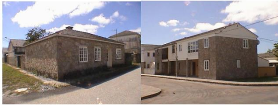
viviendas en ARNEIRO

que máis me interesou foi poder escribir en diálogo con ela. En xeral, o proceso de escritura pode ser algo solitario e gustábame o experimento de pensalo como unha conversa.