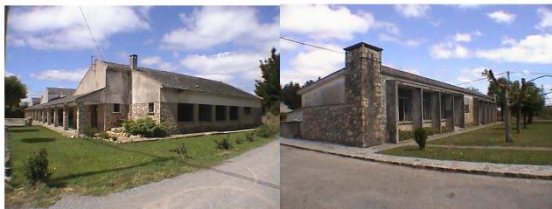
Escuela de capacitación agraria ARNEIRO escuela unitaria ARNEIRO

Interesoume tamén o ángulo elixido pola fundación para a colección, unha literatura de textos híbridos e singularidades; unha aposta polos xéneros que están nas marxes. Penso que o libro causa nas persoas lectoras certa perplexidade: é unha novela? ou outra cousa? Ás veces chámolle novela simplemente porque me parece que en moitos sistemas literarios textos moito máis radicais que este reciben o nome de novelas e, polo tanto, paréceme importante que esteamos dispostos a chamarlles novelas a cousas que xogan coas nosas expectativas do que unha novela debería ser. Pero interésame máis a perplexidade que buscar unha definición fixa: a literatura ten que xogar coas nosas ideas do que pode ser o literario, e agradezo que Euseino? crease unha colección que explicitamente nos convida a iso.