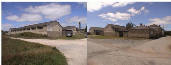
parque de maquinaria ARNEIRO