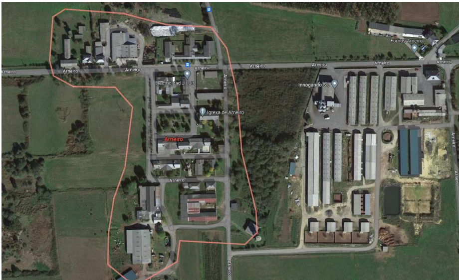
Arneiro. Cospeito, Lugo Poboado de Colonización.